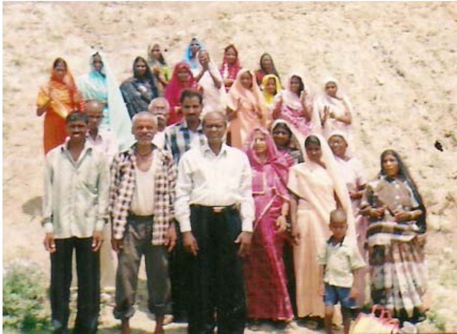
ഞങ്ങൾ കർത്താവിനോട് ചേർന്നവർ : മാവു ജില്ലയിലെ മര്യാദ്പൂർ ഗ്രാമത്തിൽ ജലസന്ദാനം സ്വീകരിച്ച് ക്രിസ്തുവിനോട് ചേർന്ന ഗ്രാമവാസികൾ.