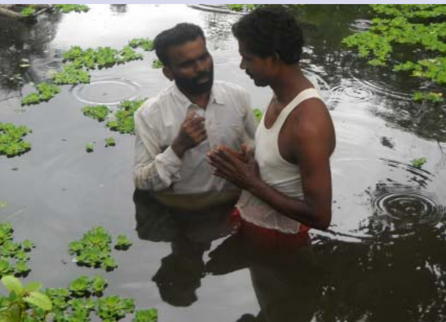
പശ്ചിമ ബംഗാളിലെ ബാസീർഘട്ടിൽ വച്ച് 2010 സെപ്റ്റംബർ 17-ാം തീയതി നടന്ന 18 സഹോദരങ്ങളുടെ സ്നാന ശുശ്രൂഷയിൽ നിന്നും