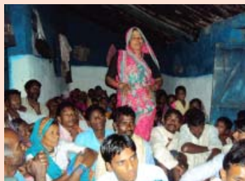
അത്ഭുത സാക്ഷ്യം പ്രസ്താവിക്കുന്നതിന്റെ ദൃശ്യം

കൃഷിക്കാരാണ് ബോർഗഡിലെ ജനങ്ങൾ. ഗ്രാമത്തിൽ നിന്നും രാവിലെ 3 മണിക്ക് പുറപ്പെട്ട് 35 കിലോ മീറ്റർ നടന്നു പോയിട്ടാണ് അവരുടെ സാധനങ്ങൾ വിൽക്കുന്നത്. അടിസ്ഥാന സൗകര്യങ്ങൾ ഒന്നും തന്നെ ഇല്ലാത്ത ആ ഗ്രാമത്തിൽ വൈദ്യുതിയും മറ്റു സൗകര്യങ്ങളും ലഭിക്കുന്നതിനായി ഞങ്ങൾ പ്രാർത്ഥിച്ചു. തിരകെ നാട്ടിൽ വന്നതിനു