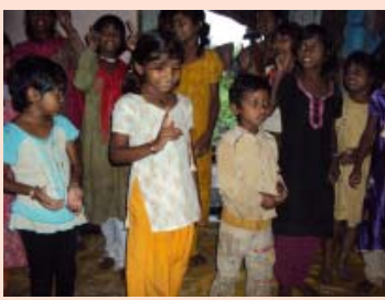
സൺഡേ സ്കൂൾ കുഞ്ഞുങ്ങൾ അവതരിപ്പിച്ച പരിപാടിയിൽ നിന്നും

കളക്ട്രേറ്റ് വരെയുള്ള ആവശ്യങ്ങൾ നിറവേറ്റി കൊടുക്കുന്നു. വ്യക്തിപരമായി നല്ല ഒരു ബന്ധം സൃഷ്ടിച്ചതിനുശേഷം ക്രിസ്തുവിന്റെ സ്നേഹത്തെക്കുറിച്ച് പറയുന്നു. രോഗികൾക്കു വേണ്ടി പ്രാർത്ഥിക്കുന്നു. ഭൃതങ്ങൾ പുറത്താക്കുന്നതും രോഗികൾ സൗഖ്യമാകുന്നതും കാണുമ്പോൾ ധാരാളം ആളുകൾ ക്രിസ്തുവിനെക്കുറിച്ച് വരുന്നു.