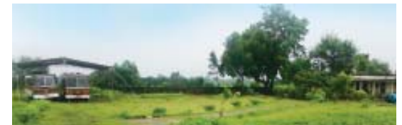
അനുഗ്രഹസേവാ ആശ്രമത്തിന്റെ വിപുലമായ പദ്ധതികൾക്കായി ഒരുക്കപ്പെട്ടിരിക്കുന്ന സ്ഥലത്തിന്റെ ദൃശ്യം

ജി.എം.ഐയുടെ അനുഗ്രഹസേവാ ആശ്രമം ഇന്ത്യയുടെ മദ്ധ്യഭാഗപട്ടണമായ മഹാരാഷ്ട്രയിലെ നാഗ്പൂരിൽ സ്ഥിതി ചെയ്യുന്നു. നാഗ്പൂർ - കാറ്റോൾ ഹൈവേയിലാണ് ജി.എം.ഐയുടെ മിഷൻ സ്റ്റേഷൻ. ജി.എം.ഐയുടെ മൊബൈൽ ടെന്റ് മിനിസ്ട്രി ഇവിടെ കേന്ദ്രീകരിച്ചാണ് പ്രവർത്തിക്കുന്നത്. അനുഗ്രഹസേവ ആശ്രമം സന്ദർശിക്കുന്നതിനോടൊപ്പം നാഗ്പൂരിലെ വളരെ പ്രധാനപ്പെട്ട സ്ഥലങ്ങളായ സീറോ മൈൽ സ്റ്റോൺ, സെമിനാരി ഹിൽസ്, ആൾ സെയിന്റ്സ് കത്തീഡ്രൽ, ഓറഞ്ച് തോട്ടങ്ങൾ, 1840 ചർച്ച്, N C C I യുടെ കാമ്പസ്, ദീക്ഷ ഭൂമി എന്നിവയും സന്ദർശിക്കുന്നതാണ്.