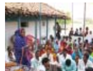
ജി.എം.ഐയുടെ ഹപ്പാറ മിഷൻ സ്റ്റേഷനിലെ ചില ദൃശ്യങ്ങൾ