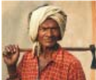
ഗോണ്ട്, ഭിൽ ആദിവാസികൾ