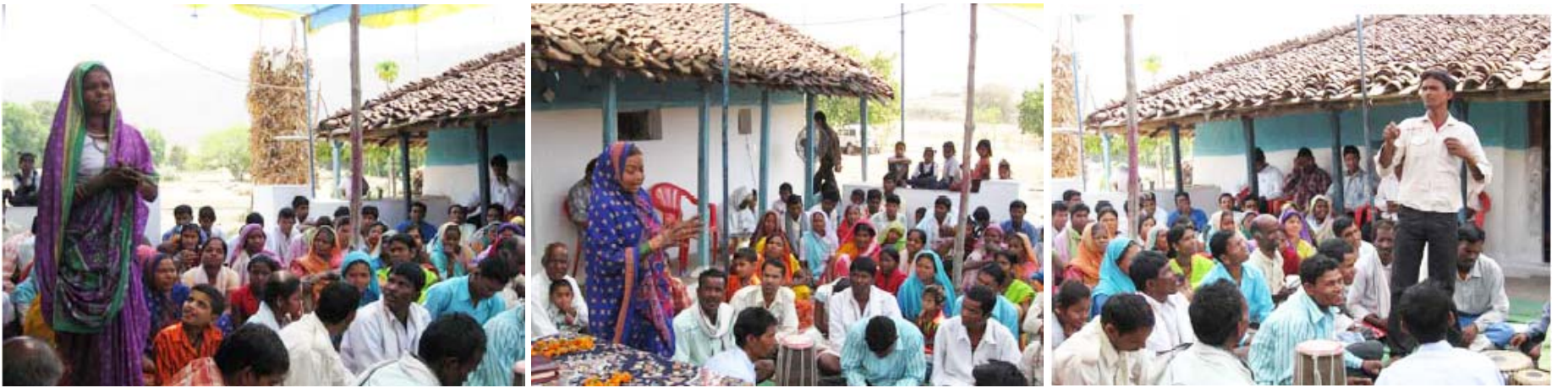
ഹർപ്പാറയിൽ ഇതുവരെ നടന്ന പ്രവർത്തനങ്ങളിലൂടെ ക്രിസ്തുവിലേക്ക് വന്ന അനേകരിൽ നിന്നും തങ്ങളുടെ ജീവിതത്തിലെ സാക്ഷ്യം പ്രസ്താവിച്ച പഞ്ചായത്ത് പ്രസിഡന്റിന്റെ സഹധർമ്മിണി, ഗ്രാമീണ യുവാവ്, മറ്റൊരു ഗ്രാമീണ സ്ത്രീ എന്നിവർ