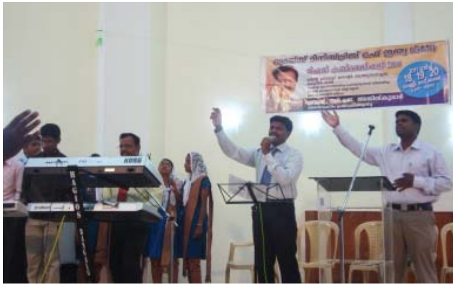
സ്തുതി സ്തോത്രങ്ങളോടെ : ബാംഗ്ലൂർ മിഷൻ കൺവെൻഷനിൽ കർത്താവിന് സ്തുതി സ്തോത്രങ്ങൾ അർപ്പിക്കുന്ന ഗായക സംഘം

“ഞങ്ങളുടെ കടക്കാരോട് ഞങ്ങൾ ക്ഷമിച്ചിരിക്കുന്നതുപോലെ ഞങ്ങളുടെ കടങ്ങളെ ഞങ്ങളോടും ക്ഷമിക്കണമേ” എന്ന വ്യവസ്ഥയോടെ പിതാവിനോട് പ്രാർത്ഥിക്കുവാൻ തന്റെ ശിഷ്യന്മാരെ പഠിപ്പിച്ച കർത്താവായ യേശുക്രിസ്തുവിന്റെ പ്രാർത്ഥനയുടെ ആഴങ്ങളിലേക്ക് വിശ്വാസികളെ നയിച്ചു കൊണ്ട് 2011 മാർച്ച് 18 മുതൽ 20 വരെ ബാംഗ്ലൂർ, കല്യാൺ നഗർ ബാബുസപാളയ സെന്റ്. തോമസ് സെന്ററിൽ വെച്ചു നടന്ന രണ്ടാം ബാംഗ്ലൂർ മിഷൻ കൺവെൻഷൻ സമാപിച്ചു.