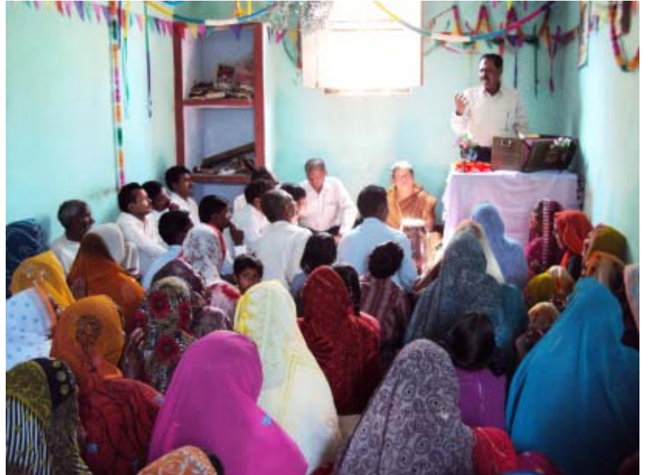
ഉത്തർപ്രദേശിലെ ജി.എം.ഐ മിഷണറി സഹോദരന്മാർ ഒരുമിച്ച് ചേർന്നപ്പോൾ