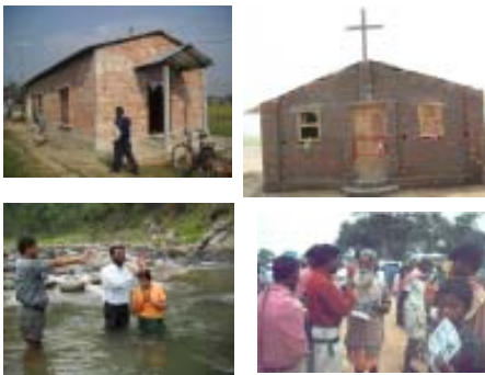
റസിഡൻഷ്യൽ മിഷണറി പ്രവർത്തനങ്ങൾ

ഇന്ത്യയിലും അയൽരാജ്യങ്ങളായ നേപ്പാൾ, ഭൂട്ടാൻ, ബംഗ്ലാദേശ് എന്നിവിടങ്ങളിലുമായി ഗ്രെയ്സ് മിനിസ്ട്രീസ് ഓഫ് ഇന്ത്യ നേതൃത്വം നൽകി വരുന്ന പ്രവർത്തനങ്ങൾ അനവധിയാണ്. താങ്കൾക്കും ഇതിൽ പങ്കാളിയാകാം.