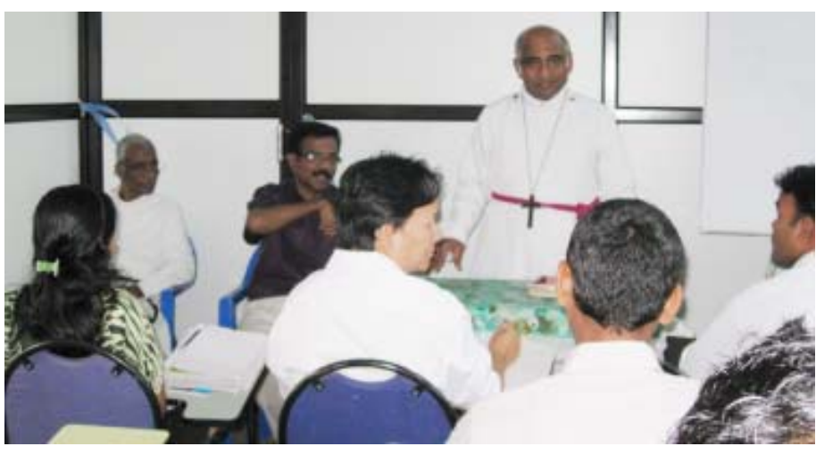
വിദ്യാർത്ഥികളോട് ചേർന്ന് അല്പനിമിഷം : ടൈംസ് ക്ലാസ്റൂമിലെ ഒരു ദൃശ്യം