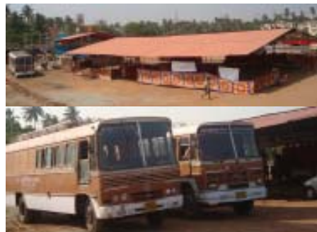
സഞ്ചരിക്കുന്ന കുടാര ശുശ്രൂഷ