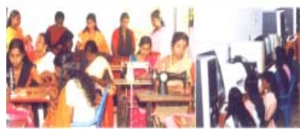
സൗജന്യ വിദ്യാഭ്യാസ പരിപാടികൾ