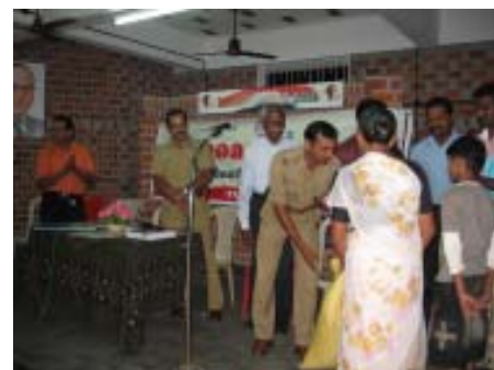
ഹാപ്പി ഫാമിലി മിഷൻ

Grace Ministries of India, Nanthancode Trivandrum- 695 003 ☎ 0471 - 2311439 E-mail : gmi@greeceindia.in www.greeceindia.in A/C No. 009901000020000 (I.O.B, Main Branch, Statue, Trivandrum)