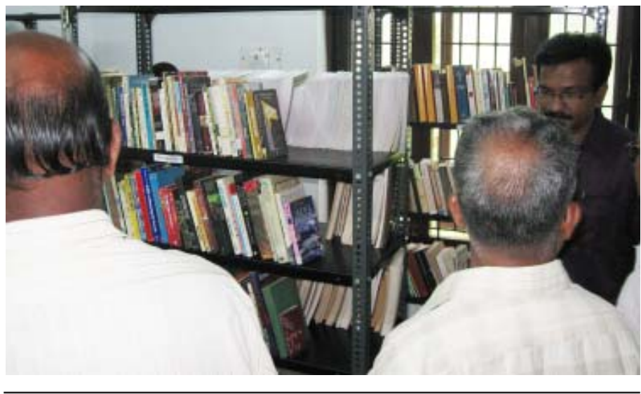
അറിവിന്റെ ഖനി : ടൈംസ് ലൈബ്രറി