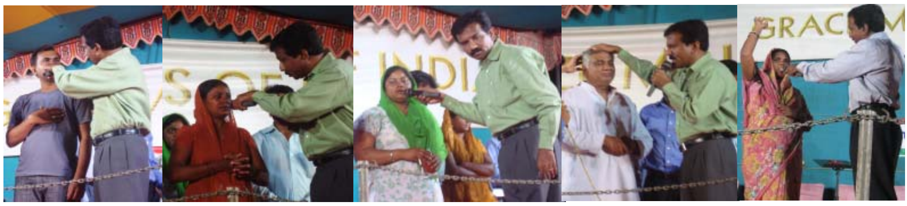
സാക്ഷികളുടെ വലിയ സമൂഹം: നരേല ദസറാ മൈതാനത്തിൽ നടന്ന യോഗങ്ങളിൽ ദൈവം ചെയ്ത അത്ഭുത അനുഭവങ്ങളെ സാക്ഷിക്കുന്നു

ളിൽ ഏറ്റവും ഫലവത്തായിത്തീരുന്ന ക്രിസ്തുവിൻ ശുശ്രൂഷയ്ക്കുവേണ്ടി പ്രാർത്ഥിക്കാം, പ്രവർത്തിക്കാം, ചെലവിടാം.