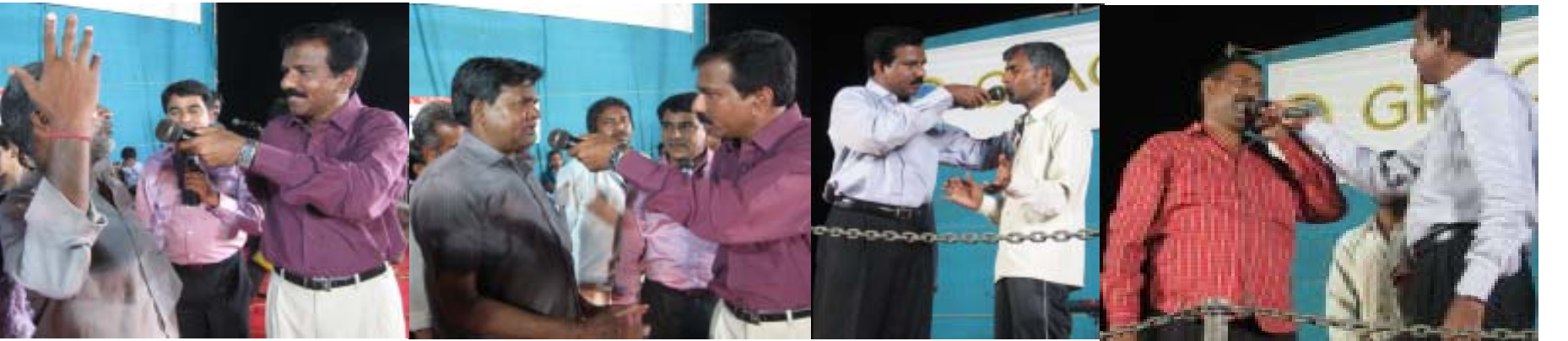
സാക്ഷികളുടെ വലിയ സമൂഹം: നരേല ദസറാ മൈതാനത്തിൽ നടന്ന യോഗങ്ങളിൽ ദൈവം ചെയ്ത അത്ഭുത അനുഭവങ്ങളെ സാക്ഷിക്കുന്നു. വിവിധ രോഗങ്ങളിൽ നിന്നും പൈശാചിക ബന്ധനങ്ങളിൽ നിന്നും വിടുതൽ പ്രാപിച്ച അനേകർ ഈ യോഗങ്ങളിൽ അനുഭവങ്ങൾ പ്രസ്താവിച്ചു.

മുൻതൂക്കം നൽകി വരുന്നത്. 6 മിഷണറിമാരും ത്രിപുരയിലെ തനതു ഗോത്രവർഗ്ഗ വിഭാഗത്തിൽ പെട്ടവരാണ്. അവരുടെ ഇടയിൽ നിന്നും കൂടുതൽ മിഷണറിമാർ തിരഞ്ഞെടുക്കപ്പെടേണ്ടതുണ്ട്. ത്രിപുരയിലെ ജി.എം.ഐ മിഷൻ പ്രവർത്തനങ്ങളെ നേരിൽ കാണുവാനും വിലയിരുത്തുവാനും ലഭിച്ച അവസരത്തിനായി ദൈവത്തെ സ്തുതിക്കുന്നു. പ്രതികൂല കാലാവസ്ഥകളിൽ തകർന്നുപോകാത്ത ചർച്ച് ഹാളുകൾ അവിടെ നിർമ്മിക്കേണ്ടതായുണ്ട്. അദ്വൈത കാർഷികളുടെ സഹകരണം ഇക്കാര്യത്തിൽ ഉണ്ടാകേണ്ടതിനായും ത്രിപുരയിലെ മിഷൻ പ്രവർത്തനങ്ങൾ ഇനിയും അഭിവൃദ്ധിയിലേക്ക് നയിക്കപ്പെടട്ടെ.