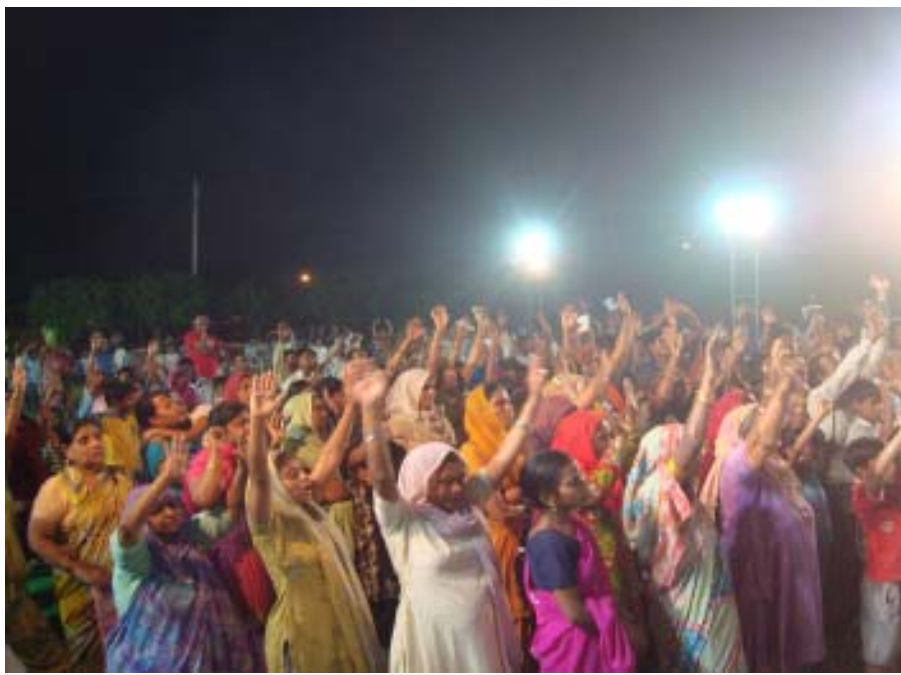
നന്മയുടെ സുവിശേഷത്തിന്റെ കാലോച്ച: വടക്കൻ ഡൽഹിയിലെ നരേല, ദസറാ ഗ്രൗണ്ടിലെ സുവിശേഷ മഹായോഗത്തിൽ സന്നിഹിതരായ ജനാവലി

നരേല: ഡൽഹിയുടെ വടക്കേ അറ്റത്തു സ്ഥിതി ചെയ്യുന്ന നരേലാ ഹരിയാന യോടു ചേർന്നു കിടക്കുന്നു. ഡൽഹി സംസ്ഥാനത്തിൽ വളർച്ചയിൽ രണ്ടാം സ്ഥാനത്തു നിലക്കുന്ന പ്രദേശം. ജന സംഖ്യ 4,72,000-ത്തിലധികം വരുന്ന ഇവിടെ ക്രൈസ്തവരുടെ എണ്ണം 2000-ൽ താഴെ. ഒരു കത്തോലിക്ക പള്ളിയും മെഥഡിസ്റ്റ് പള്ളിയും മാത്രമുള്ള ഈ പ്രദേശത്ത് ഇതുവരെയും ഒരു പരസ്യ ക്രിസ്തീയ യോഗങ്ങളും നടന്നിട്ടില്ല. ഇവിടെ നരേലാ സെക്ടർ 10-ലുള്ള ദസറാ ഗ്രൗണ്ടിൽ വെച്ചായിരുന്നു “മസി പുനരുത്ഥാൻ ജയന്തി സമാരോഹ്” എന്നു നാമകരണം ചെയ്ത നാലു ദിവസത്തെ സുവിശേഷ യോഗങ്ങൾ ഗ്രെയ്സ് മിനിസ്റ്റീസ് ഒഫ് ഇന്ത്യയുടെ നേതൃത്വത്തിൽ ക്രമീകരിക്കപ്പെട്ടത്. മാനവരക്ഷക്കായുള്ള ആത്യന്തിക വെളിച്ചപ്പാടായ ക്രിസ്തുവിന്റെ സനാതന സുവി