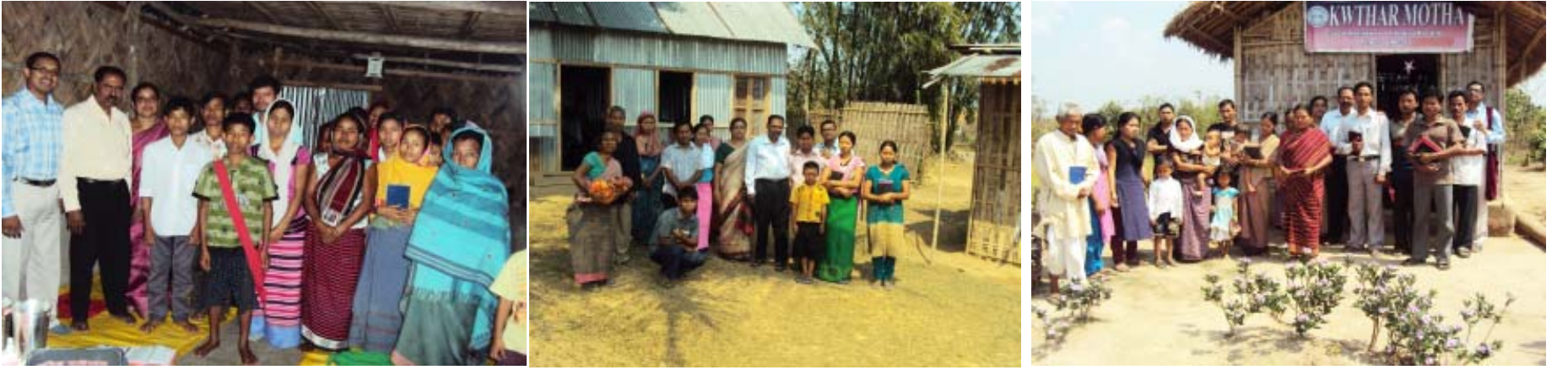
മാഹാത്മ്യത്തിന്റെ സാക്ഷികൾ: ത്രിപുരയിലെ വിവിധ മിഷൻ ഫീൽഡുകളിലുള്ള വിശ്വാസികളും അവിടത്തെ മിഷണറിമാരും

സുവിശേഷ പ്രവർത്തനത്തിന് എടുത്തു പറയത്തക്ക പ്രതികൂലങ്ങൾ നിലവിലില്ലാത്ത സംസ്ഥാനമാണെങ്കിലും ഇവിടെയുള്ള ഗോത്ര വർഗ്ഗക്കാരെ സുവിശേഷീകരിക്കുക എന്നത് വളരെ ശ്രമകരമായ ഒരു ദൗത്യമാണ്. തദ്ദേശീയരായ മിഷണറിമാരെക്കൊണ്ട് മാത്രമേ ഇത് സാധിക്കുകയുള്ളൂ. അത്തരത്തിലൊരു പ്രവർത്തനത്തിനു തന്നെയാണ് ജി.എം.ഐ. ഇവിടെ