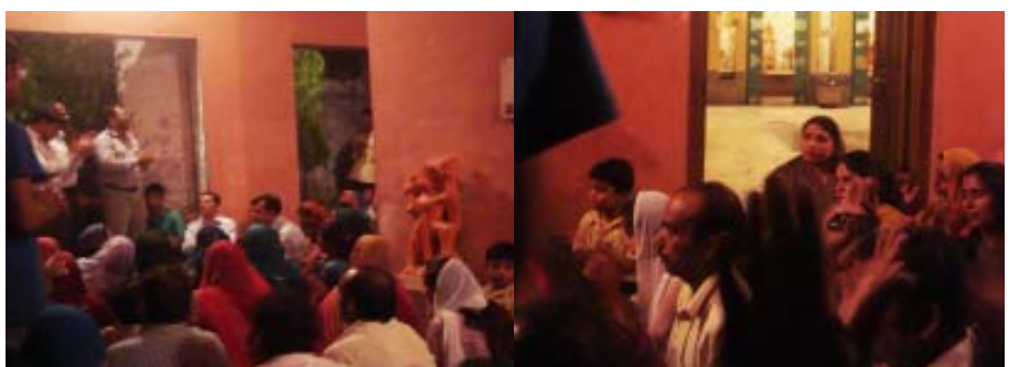
അതിർത്തികൾ തകർക്കുന്ന ദൈവ പ്രവൃത്തി : വടക്കൻ ഡൽഹിയിലെ നരേലയിൽ ശിവക്ഷേത്രത്തിനകത്ത് ക്രമീകരിച്ച രണ്ടാം ദിവസത്തെ യോഗത്തിൽ നിന്നുള്ള ദൃശ്യങ്ങൾ

നരേലാ : സുവിശേഷ മഹായോഗത്തിന്റെ രണ്ടാം ദിനം (6-5-11) ദുഷ്ടന്റെ കോട്ടകളെ തകർക്കുന്ന ജീവന്റെ ശബ്ദം മുഴങ്ങുവാൻ തടസ്സമായി കോരിച്ചൊരിയുന്ന മഴയും കൊടുങ്കാറ്റുമെത്തിയത് ഏവരെയും നിരാശയിലാഴ്ത്തി. എന്നാൽ അവിടെയും സകല അതിർത്തിയുടെ മതിൽ കെട്ടുകളെയും തുറന്നു കൊണ്ട് പുതിയ കൊയ്ത്തു പാടത്തേക്കു തന്റെ ജനത്തെ നടത്തിയ സ്നേഹ പിതാവിന്റെ പ്രവർത്തിയാണു ദർശിക്കുവാൻ ഇടയായത്. ആ ദിവസത്തെ സുവിശേഷ യോഗം നടത്തുവാനായി അടുത്തുള്ള ശിവക്ഷേത്രത്തിന്റെ വാതിൽ അവിടുത്തെ പുജാരി തുറന്നു കൊടുത്തപ്പോൾ തകർന്നത് ജാതിമത വകഭേദത്തിന്റെ പേരിൽ മാനവ ജനതയെ വേർതിരിക്കുന്ന മതിൽക്കെട്ടായിരുന്നു. സകല മാനവരാശിയെയും രക്ഷിക്കുന്ന മഹാത്യാഗത്തിന്റെ ക്രിസ്തുവിൻ സ്നേഹം വടക്കൻ ഡൽഹിയിൽ ഒരു ഹൈന്ദവക്ഷേത്രത്തിനുള്ളിൽ നിന്നും ഉറക്കെ മുഴങ്ങിയപ്പോൾ വിശാലത കുറഞ്ഞ ഹൃദയവുമായി മറ്റുള്ളവരെ സമീപിക്കുന്ന ക്രൈസ്തവ ജനതയുടെ കാഴ്ചപ്പാടുകൾ മാറ്റി മറിക്കപ്പെടുകയുമായിരുന്നു.