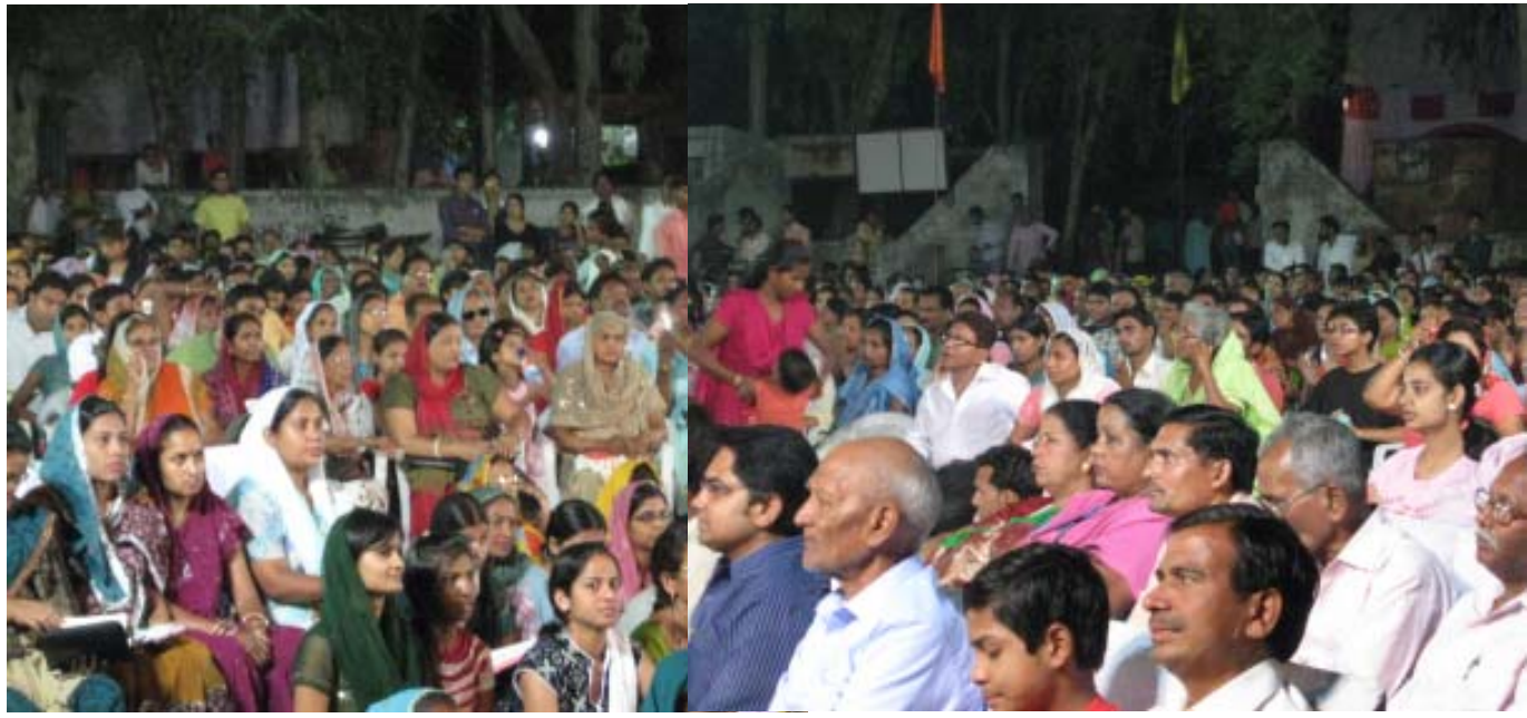
ദൈവശബ്ദത്തിനായി കാതോർത്ത് മീറ്റിലെ ഹോവാർഡ് പ്ലാസ്റ്റഡ് ഇംഗ്ലീഷ് മീഡിയം സ്കൂൾ ഗ്രൗണ്ടിൽ നടന്ന മസി സത്സംഗിൽ പങ്കെടുത്ത ജനാവലി