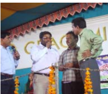
അടയാളങ്ങളാലും അത്ഭുതങ്ങളാലും വചനം സത്യം എന്നു തെളിയിക്കപ്പെട്ടു മീറ്റിൽ നടന്ന മസി സത്സംഗത്തിൽ അത്ഭുത രോഗശാന്തിയും, വിടുതലും അനുഭവിച്ചവർ വചനശുശ്രൂഷയ്ക്കും പ്രാർത്ഥനയ്ക്കും ശേഷം മുന്നിലേക്കു വന്നു അവരുടെ അനുഭവങ്ങൾ പങ്കുവെക്കുന്നു.